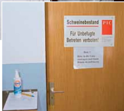
Ein strenges Hygieneprogramm bildet die Basis für eine erfolgreiche Sanierung.

Für den Nachweis der Dysenterie und die nachfolgende Bekämpfung ist eine fachgerechte Diagnose unverzichtbar. Gelegentlich wird versucht, aufgrund der Farbe des Durchfalls auf den Erreger zu schließen. Dies muss aber als unseriöse „Spökenkiekerelei“ abgelehnt werden, da jeder bekannte Durchfallerreger wie auch Vergiftungen und Fütterungsfehler gleich aussehende Durchfälle hervorrufen können. Als Erreger kommen dabei in Frage: