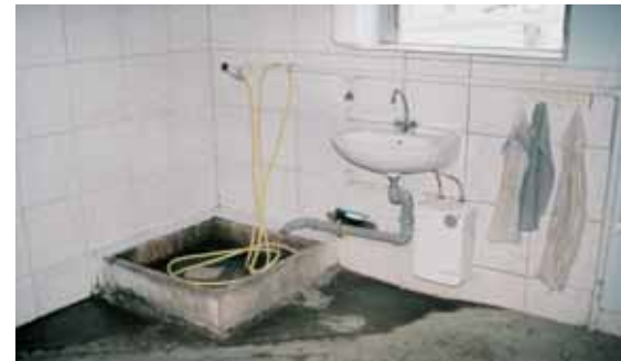
Hygieneschleusen tragen dazu bei, mögliche Infektionsketten zu unterbrechen.

einer zugelassenen Futtermühle eingemischt werden. „Aivlosin“ wird als Pulver in das Futter eingemischt. Eine Behandlung hat über zehn Tage in ausreichender Dosierung zu erfolgen. Nach diesen zehn Tagen werden Kotproben in entsprechender Anzahl untersucht, um gegebenenfalls nachzubehandeln. Dieses Arzneimittel wird erst seit etwa einem Jahr in der Therapie und Prävention genutzt und genießt deshalb noch den Vorteil einer guten Resistenzlage bei Dysenterie, vergleichbar mit der von „Econor“. Das Eindringen des Wirkstoffs von „Aivlosin“ in die Darmschleimhaut erleichtert zudem die Bekämpfung der Erreger.