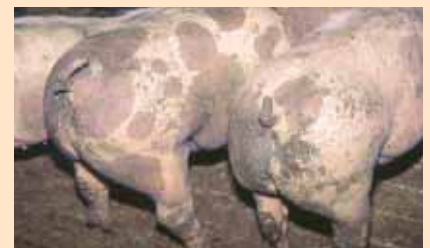
Eine sichere Diagnose „Dysenterie“ lässt sich nur über die Untersuchung von Kotproben im Labor stellen.

handlung. Sie können aber zwischen 10 und 60 Prozent liegen. Die Tiere verenden infolge starker Schwächung und Dehydratation (Flüssigkeitsverlust). Der Tod erfolgt durchschnittlich fünf Tage nach Einsetzen der klinischen Erscheinungen.– st –